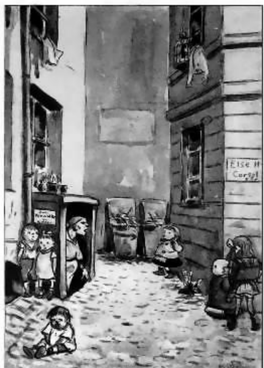
„Wollt ihr was von die Blanz, spidit mir'n Müllkasten!“