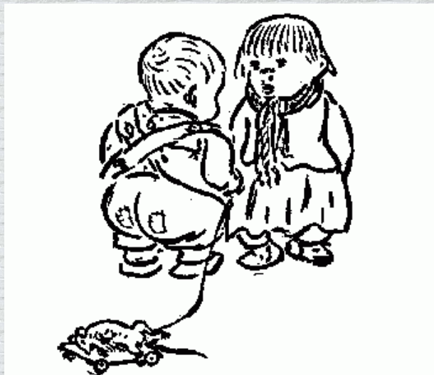
„Von wat is se denn jesterbn?“ „Unse Wohnung is zu naß!“