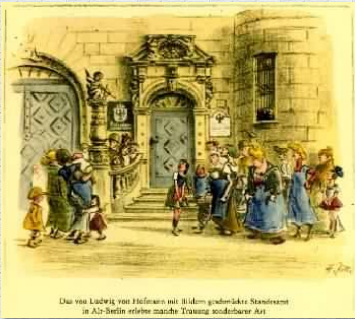
Das von Ludwig von Hofmann mit Bildern gedruckte Standesamt in Alt-Berlin erlebte manche Trauung sonderbarer Art.