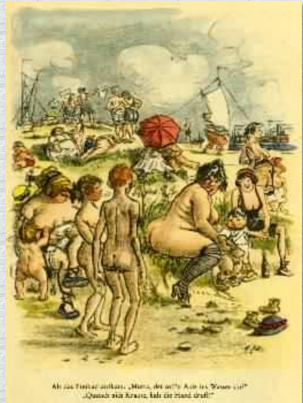
Alle das Festival anhalten. „Mama, ich will die Aale im Wasser sein!“ „Gibst du dir keine, hab die Hand drauf!“