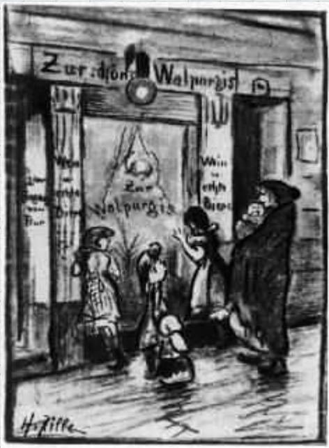
Die rote Laterne: „Mutter, ich seh' Varen bei die rote Hexe sitzen!“