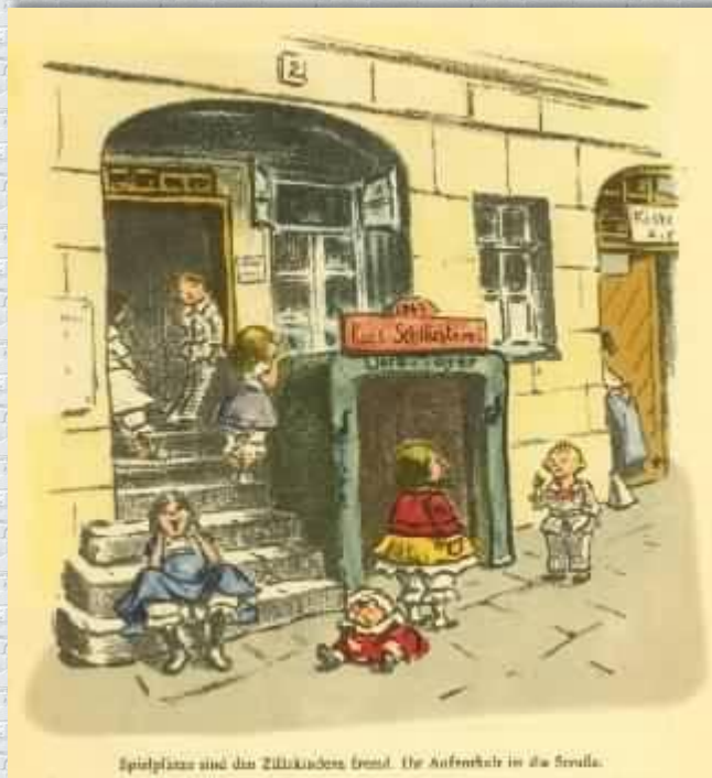
Spielplatz sind die Zillkinder freud. Die Aufbruch in die Schule.