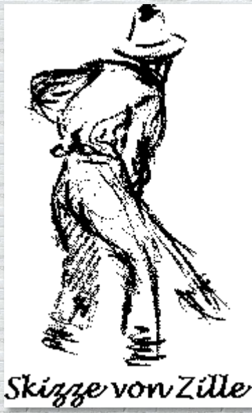
Skizze von Zille