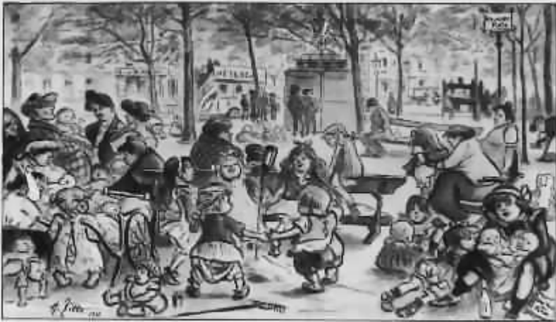
Berlin N. Otto Nagel's Heimat.