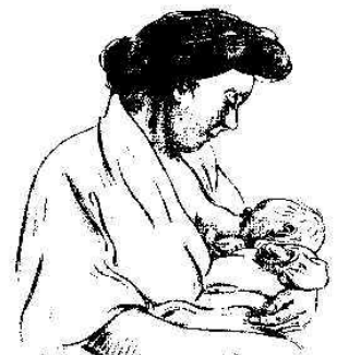
Eine außergewöhnliche Rolle nimmt bei Zille, Mutter und Kind ein.

Heinrich Zille hat es in seiner Entwicklung zum Künstler nicht leicht gehabt. Er hat sich alle Techniken, alle Kniffe mühselig erwerben müssen. Der ihm vom alten Hosemann erteilte Rat, hinauszugehen auf die Straße, ins Freie, das Leben zu beobachten, blieb ihm gewissermaßen Leitfaden während seines ganzen Lebens als Künstler. Wo er ging und stand, auf der Straße, in der Kneipe, auf dem Rummelplatz und in Verkehrsmitteln, in der Mietskaserne oder in der Parkanlage, immer machte er auf kleinen Papierblättchen, die er stets mit sich führte, seine Studien. Schnell mit wenigen Kreidestrichen hielt er das Geschehene fest, „notieren“ nannte er bescheiden diese Art Tätigkeit. Seine Modelle mußten nicht stillsitzen, je mehr Bewegung, um so interessanter. Sein Hauptinteresse lag an Kindern und an Menschenansammlungen. Er zeichnete eben so wie das Leben es ihm zeigte. Und genauso kennen ihn seine Freunde, und genauso hat ihn die Welt kennengelernt.