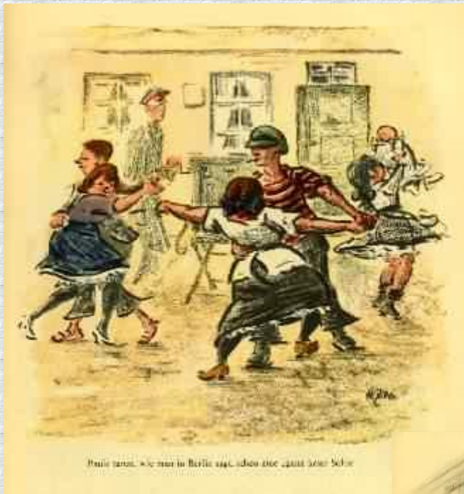
Paris 1889. Wie man in Berlin sagt, ich bin eine ganz gute Schöne