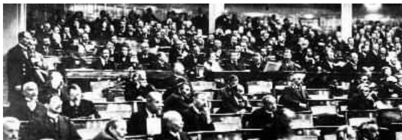
Die Nationalversammlung tagt im Nationaltheater in Weimar

in der deutschen Geschichte die parlamentarische Demokratie.