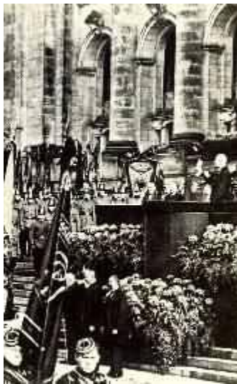
Traueransprache für Stresemann vor dem Reichstag

Mitte 1932 erreicht die Wirtschaftskrise mit über 6 Millionen Arbeitslosen ihren Höhepunkt. Die Parteizersplitterung hat ihren Höhepunkt erreicht. Sie war einer der Gründe für das Scheitern der Republik. Die NSDAP ist nun in-zwischen zur weitaus stärksten Partei herrangewachsen. Die Weimarer Republik geht dem Untergang entgegen.