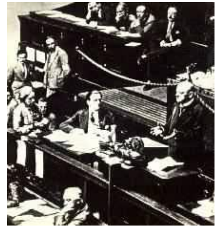
Außenminister Stresemann bei einer Rede vor dem Völkerbund.

Das Kabinett Brüning, ohne Koalitionsbindung und Reichstagsmehrheit regierend, wird der Krise nicht Herr. Im Volke breitet sich Hoffnungslosigkeit aus. Aus den Reichstags-wahlen vom 14. September gehen die Nationalsozialisten mit 107 Sitzen als Sieger hervor.