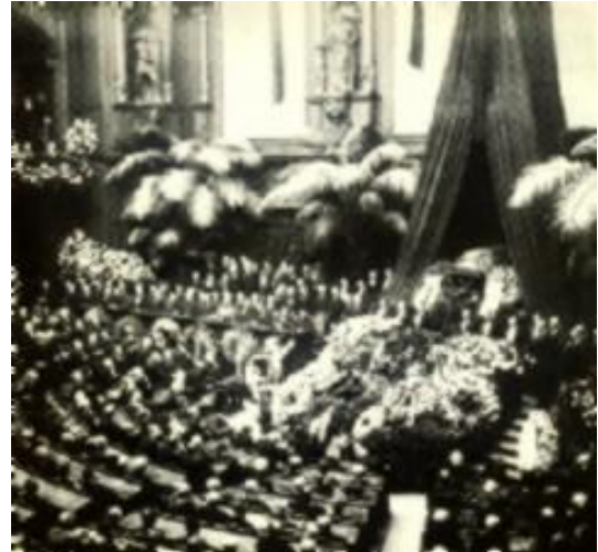
Trauerfeier im Plenarsaal des Reichstages. Am Rednerpult unter Blumen und Kränzen die sterbliche Hülle Rathenaus. Seine Mörder beraubten Deutschland um einen seiner besten Köpfe.

An den Spartakus-Führer Karl Liebknecht und Rosa Luxemburg, dem bayerischen Ministerpräsidenten Kurt Eisner, den Unabhängigen Sozialdemokraten Haase und Gareis, dem Zentrumsabgeordneten und ehemaligen Reichsfinanzminister Matthias Erzberger.