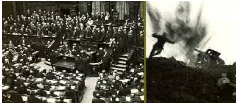
Reichstagssitzung am 4. August 1914: Die Abgeordneten bewilligen einstimmig die geforderten Kriegskredite. In den Belastungen des Weltkrieges an der Front und in der Heimat zeigt sich die Brüchigkeit des Kaiserreiches.

Im August 1914 muß Deutschland ohne wirkliche innere Bindung zwischen Regierung und Parlament in die Machtprobe des ersten Weltkrieges eintreten. In den unbarmherzigen Materialschlachten an der Kriegsfront und