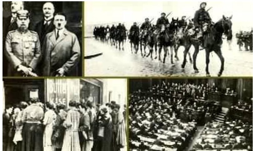
Links oben: Die Anführer des nationalsozialistischen Putsches Hitler und Ludendorff. Daneben: Einmarsch französischer Truppen in das Ruhrgebiet 1923. Darunter: Lebensmittelschlangen in der Wirtschaftskrise 1923. Rechts daneben: Sturz des Kabinetts Stresemann.

Die Republik überlebt, nicht zuletzt durch die Einsicht der Parlamentsmehrheit, die als „Große Koalition“ in die deutsche Parlaments-Geschichte eingegangen ist. Diese Koalition reicht von den Sozialdemokraten über die Demokraten und Zentrum bis zur rechtsbürgerlichen Deutschen Volkspartei. Der Kanzler dieser Koalition wird der Parteivorsitzende Dr. Gustav Stresemann. Er und Friedrich Ebert sind die Architekten dieser Koalition. Sie verstehen dieses Bündnis als den von einer soliden Reichstagsmehrheit getragenen Versuch der geschichtlichen Aussöhnung zwischen den Kräften der Tradition und der Neuordnung. - Das Bündnis bricht nach 100 Tagen auseinander.