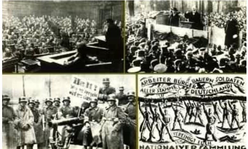
Diese Bilder zeugen von der gespannten Lage von November 1918 bis Januar 1919: Soldatenräte tagen im Reichstag. Daneben Spartakisten Demonstrationen. Regierungstreue Truppen, und Plakate die zur Nationalversammlung aufrufen.

Ebert, den Parteivorsitzenden der Mehrheitsdemokratie. Unbeirrbar hält er an seinem Kurs fest: Freie Wahlen für eine verfassungsgebende Nationalversammlung.