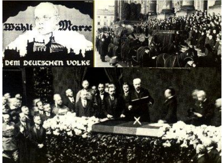
Oben: Trauerzug zu Friedrich Eberts Beisetzung. Unter: Verteidigung des neuen Reichspräsidenten von Hindenburg im Reichstag.

Auf den Trauerkondukt Friedrich Eberts folgt die Eidesleistung des neuen Reichspräsidenten Paul von Hindenburg. Wahrlich - die Geschichte der Weimarer Republik hat einen kurzen Atem, und ihr Herz schlägt im Reichstag.