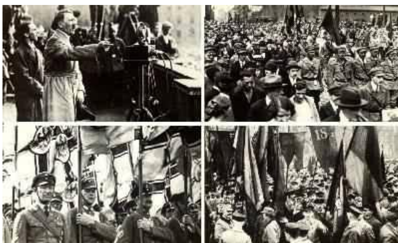
1932 ist ein Jahr des Dauerwahlkampfes mit Agitatoren, Aufmärschen und Straßenkämpfen. Links oben: Hitler auf einer Wahlkundgebung im Berliner Lustgarten. Daneben: Aufmarsch des Rotfrontkämpferbundes. Unten: Aufmärsche des Stahlhelm - Bund der Frontkämpfer und des Reichsbanners Schwarz-Rot-Gold. Bild rechts: Der Reichstagsbrand.